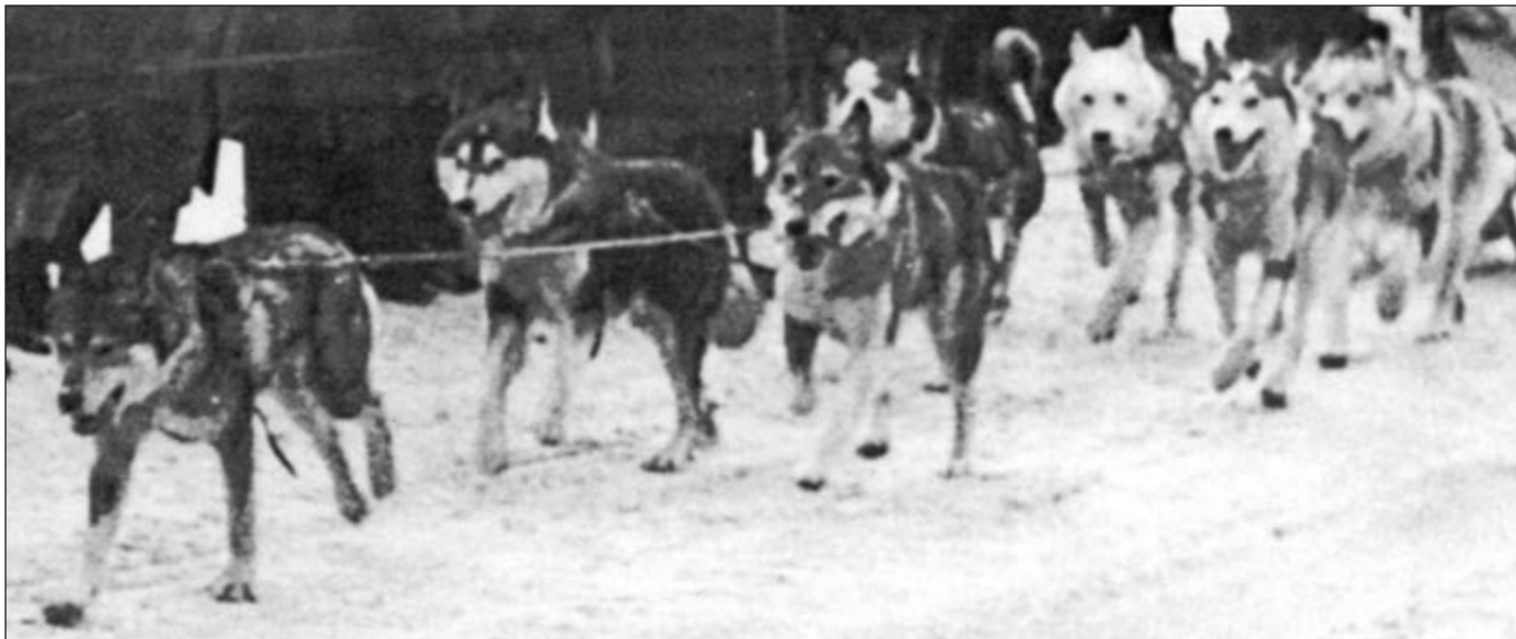
Seppin voittamaton vuoden 1929 siperialaisvaljakko Quebecin Dog Derbyssä. Johtajana Bonzo (Harry x Kolyma), kärkiparissa vasemmalla Smoky (tuntematon x tuntematon), oikealla Sneegrug (tuntematon x tuntematon), vauhtipari: vasen Bijou (tuntematon x tuntematon), oikea Kingeak (Togo x Rosie), pyöräpari: vasen Nurmi (tuntematon x tuntematon), oikea Silver (Togo x Nome). Kaikki uroksia. Nämä olivat epäilemättä Sepp'in silloiset parhaat seitsemän koira. Sepp oli hävinnyt tämän kilpailun vuosina 1927 ja 1928 ja epätoivoisesti hävitteli ainoaa suurta New England/Canada kilpailuvoittoa, jota hänellä ei vielä ollut. Tämä valjakko juoksi uuden ennätysajan kolmen päivän kilpailussa (123 mailia yhteensä).

Tämä artikkelisarja on julkaistu ISHC NEWS-lehden numeroissa 4 - 6 / 2001 ja julkaistu ISHC:n ja tekijän luvalla.