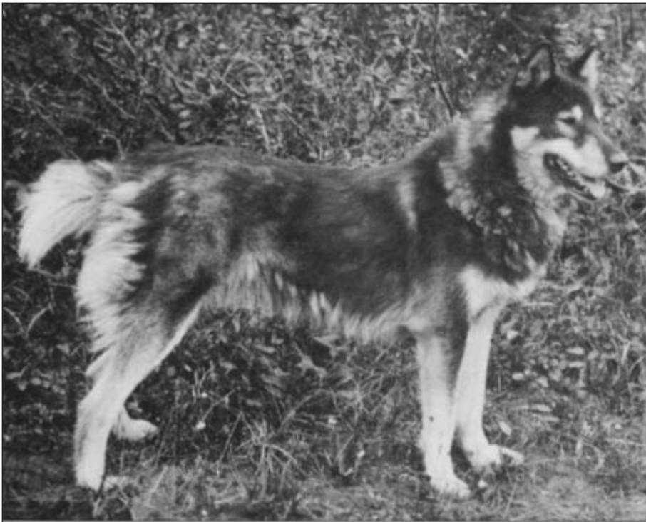
Tämä on Russky, jonka Leonhard Seppala tuotti Petropavlovskista 1914. Siitä tuli yksi Sepp'in parhaista johtajakoirista juosten kaksoisjohdossa Scottyn kanssa 1915-1917 All Alaska Sweepstakes voittoihin. Huomaa tyvistetty häntä, tapa jota korjakit käyttivät. Huomaa myös pitempi turkki ja pitempi runko suhteessa korkeuteen.