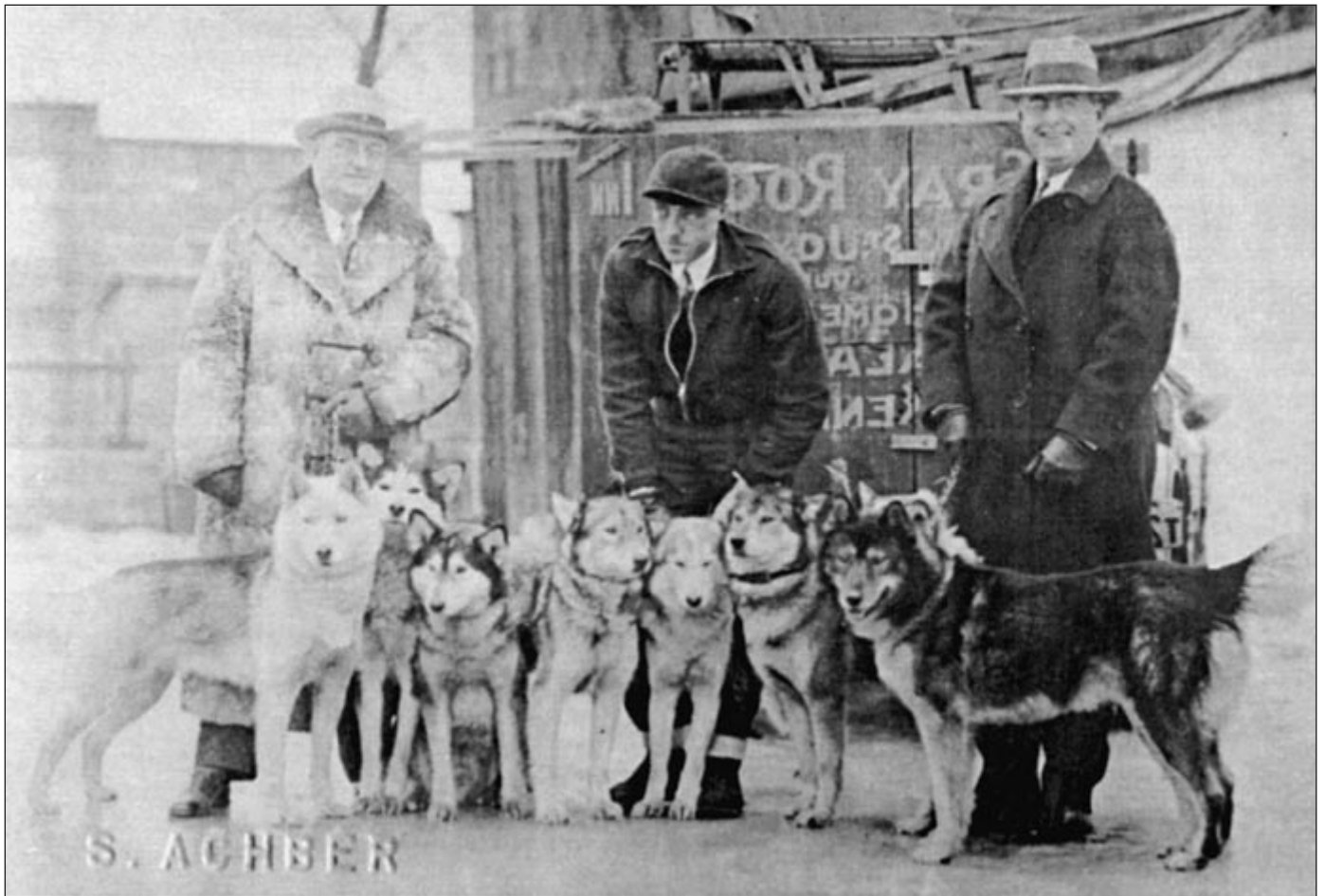
Tässä kuvassa on kaksi kolmesta eloonjääneestä viimeisestä Siperiantuonnista. Vasemmalla on Kreevanka ja kauimpana oikealla oleva tummakoira on Tserko. Nämä kaksi koiraa Peg Ricker tuotti suoraan Polar Springs, Maineen syksyllä 1930. Ne olivat osa Olaf Swensonin tuomasta 8-koiran valjakosta Ryrkaypiystä North Capen luona Siperiassa. Kuva on otettu Laconiassa, New Hampshire 1934.

Copyright 2001-2002 ISHC News. Kaikki oikeudet pidätetään.