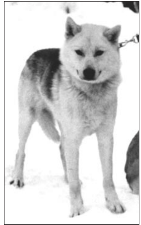
Nykypäivän kamtsatkalainen uroskoira Petropavlovskin alueelta. Turkki on HYVIN tiheä, silmät HYVIN vinot. Väri on valkoinen/kerma, jossa tumma satula. Kallo on melko leveä silmien kohdalta ja korvien asento leveämpi kuin voisi olettaa. Korvalehti on HYVIN paksu. Tämä koira on säkä-korkeudeltaan noin 56 cm tai vähemmän ja painaa noin 20-22 kiloa (on painavanpi kuin miltä näyttää). Luuston voisi arvioida olevan keski-tasoa kevyemmän.

hieman pienempiä – suurimmat noin 25-27 kg. Itäniemen alueella koirat olivat pienimpiä, noin 20 kiloisia. Kolyma-joella 27 kilon molemmin puolin – viittaa nyt vain uroksiin. Tämä on tarkinta mitä nyt muistan." (1949)