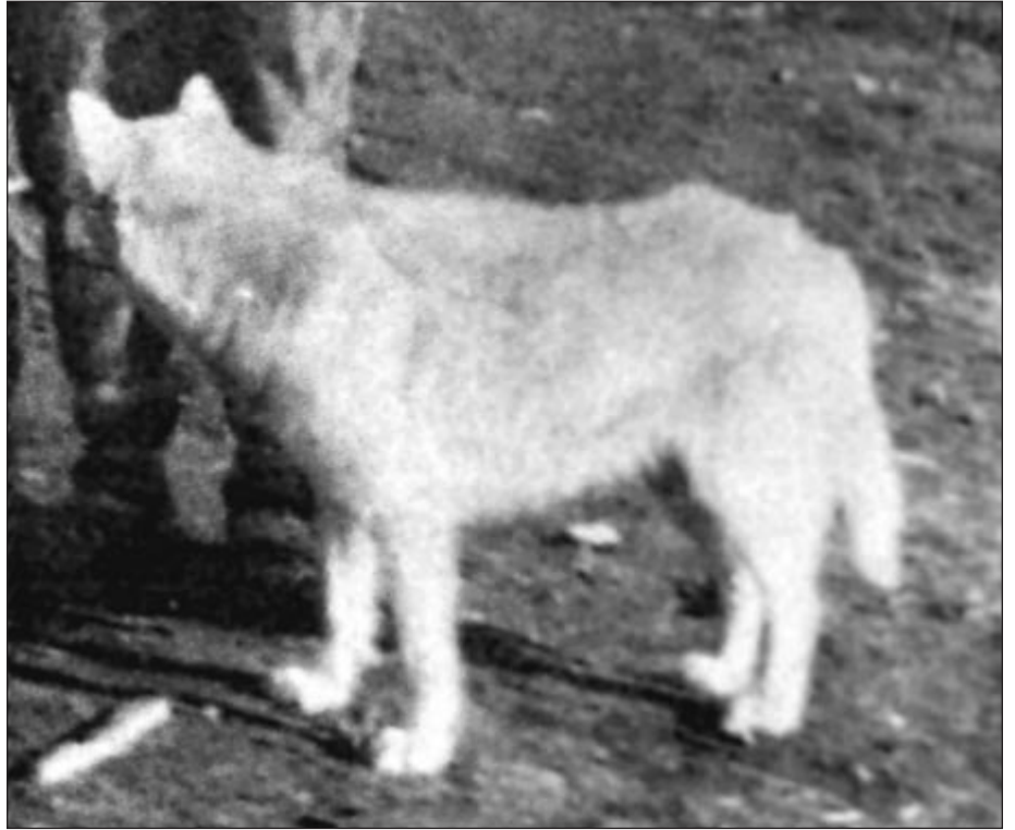
Valokuva Sakari Pälsin tutkimusmatkalta 1917. Tsuktsitaiteilija Karlayriginin koira. Kuva Museovirasto.

(Voyages and Travels in Various Parts of the World during the Years 1803, 1804, 1805, 1806 and 1807).