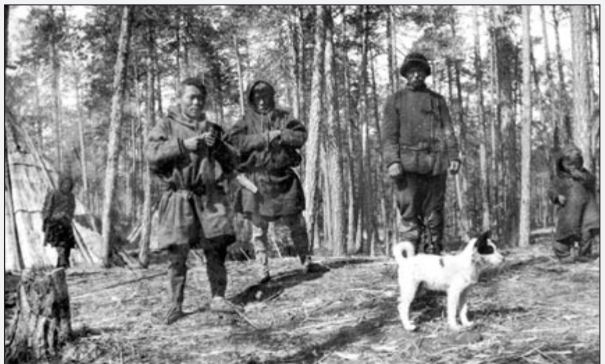
Kielentutkija Toivo Lehtisalo teki kahden vuoden mittaisen tutkimusmatkan nenetsien pariin 1911-12. Nenetsijä kesäpaikalla sääskien aikaan.

Näyttelyä ovat tukeneet Opetusministeriö ja Teboil.