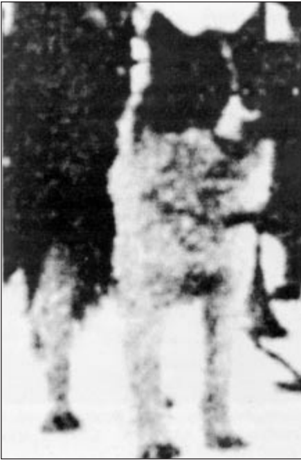
Osa Ghijigalaisesta (Giziga) valjakokoirakuvasta, kuvannut 1899 W.B. Vanderlip. Ghijiga ja samanniminen joki ovat Ohotskin meren puolella, Ghijigan lahdella- joka oli korjakkien asuinalueita.